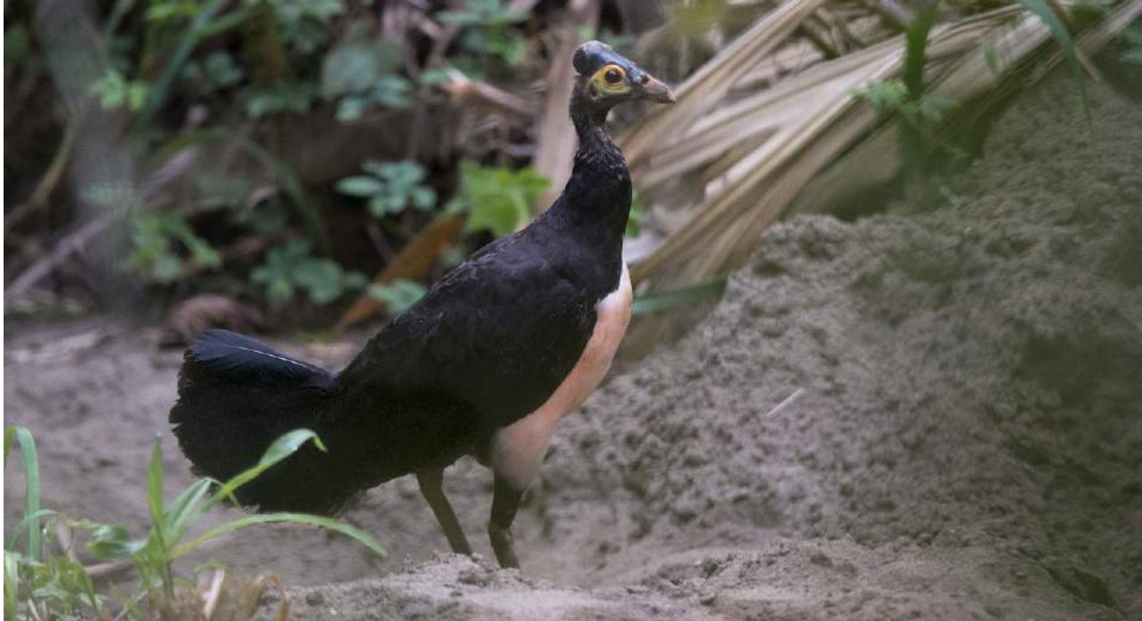
Hamerhoen - Wim de Groot