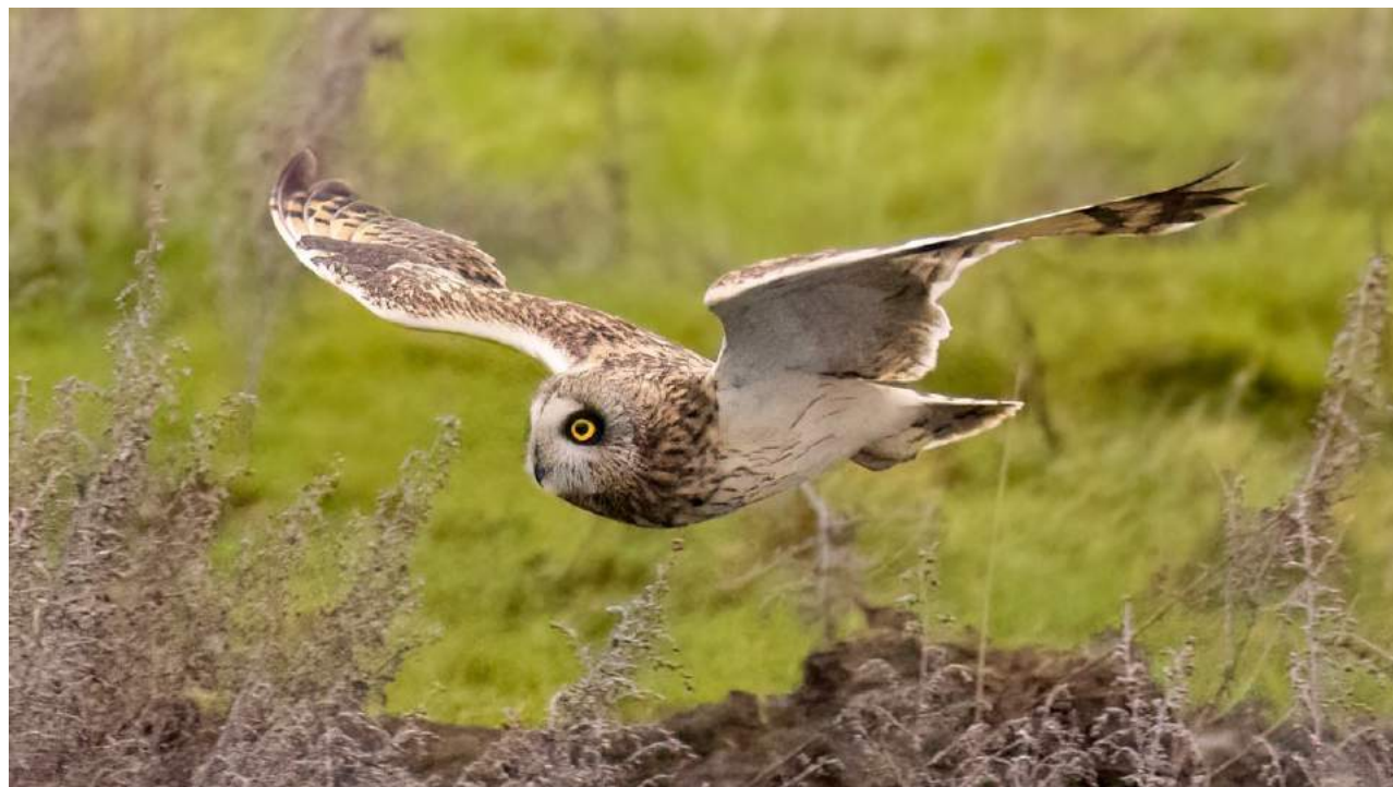
Eduard van Amstel

Uitvaartverzorging, Edisonweg 15 en bij Ball On BV die zit ook op de Edisonweg 14 C, 1821 BN, Alkmaar.