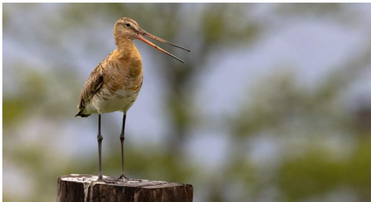
Eduard van Amstel