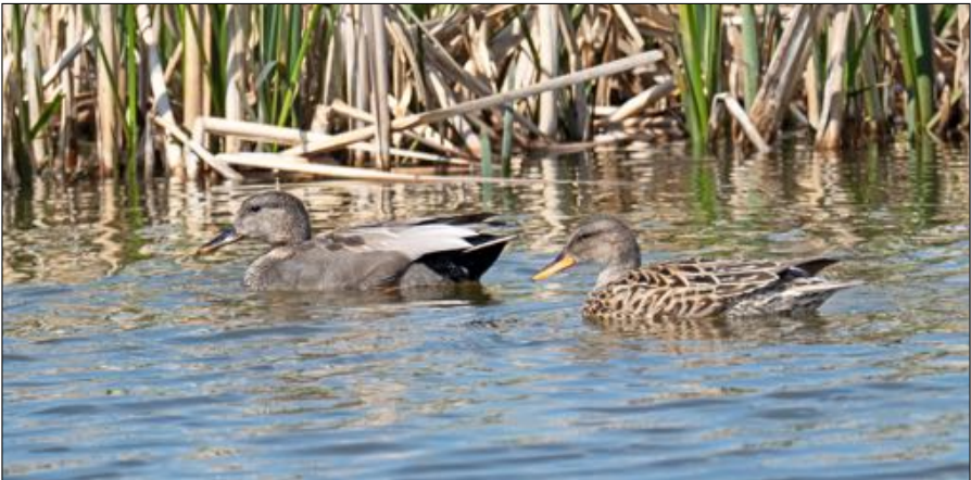
Explosieve groei van de Krakeend.

Ganzen en ook andere watervogels, zoals eenden, hebben het vermogen om een gebied snel te koloniseren. Dat komt enerzijds omdat ze grote legsels produceren en soms zelfs in staat zijn tot vervolglegels, anderzijds omdat ze een relatief hoge leeftijd bereiken als een gebied geschikt is om er te leven en zich voort te planten. Andere voorbeelden van watervogels die in de afgelopen 50 jaar snel zijn toegenomen zijn Kuifeend en Krakeend. Bij deze soorten is het niet helemaal duidelijk wat daarvan de