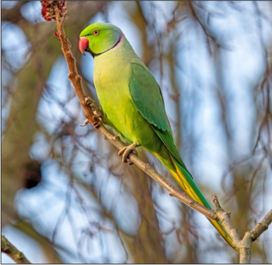
De Halsbandparkiet rukt op in het stedelijk gebied.