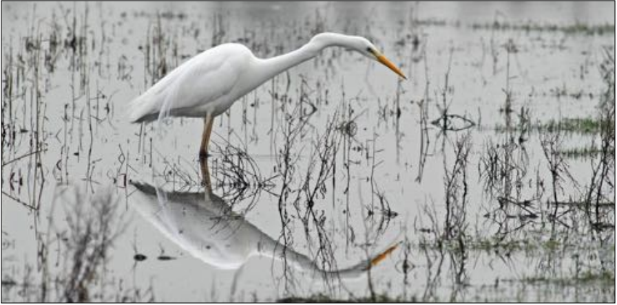
Grote Zilverreiger toekomstig broedvogel in Noord-Holland?