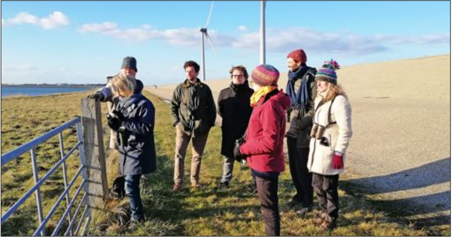
Op zoek naar de Flamingo's bij Battenoord langs de Grevenlingendam.