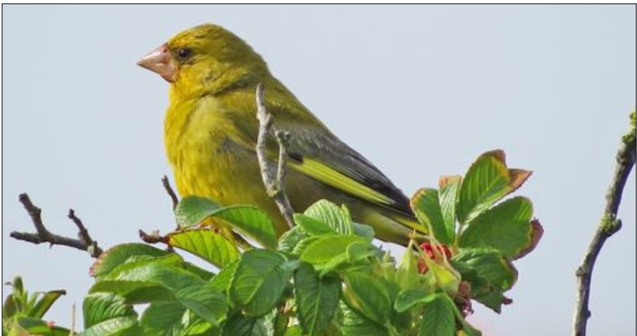
Groenling (man), Petten-Korfwater, 7 augustus 2021.

12. In de avond van 15 september 2022 bezochten 200 tot 300 Raven de vuilstort van Barneveld (Natura 2022 nr.4).