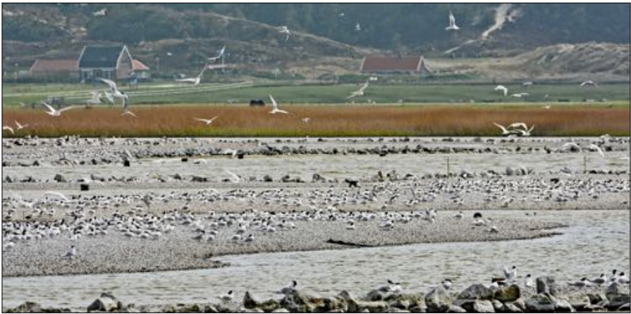
De fraaie kolonie Grote Sterns in De Putten werd in 2022 door de vogelgriep weggevaagd.

Door het plaatsen van afrasteringen wordt op sommige plaatsen geprobeerd op Vossen buiten een broedplaats te houden. Dat gebeurt vooral bij in kolonies broedende soorten die broeden op open terreinen met schaarse vegetatie, zoals Visdieven, Kluten en plevieren. Zeer succesvol was de vestiging van een grote kolonie Grote Sterns en een klein aantal Visdieven en Dwergsterns in De Putten. Grote Sterns broeden in de jaren negentig nog niet op het vasteland. Na de herinrichting van het gebied rond 2015 werd het een geschikt broedgebied. In de jaren daarvoor pleisterden er al vele honderden vogels en in 2016 kwamen de eerste broedparen. De aantallen groeiden tot meer dan 3.000 paar, tot de vogelgriep daar in 2022 een eind aan maakte.