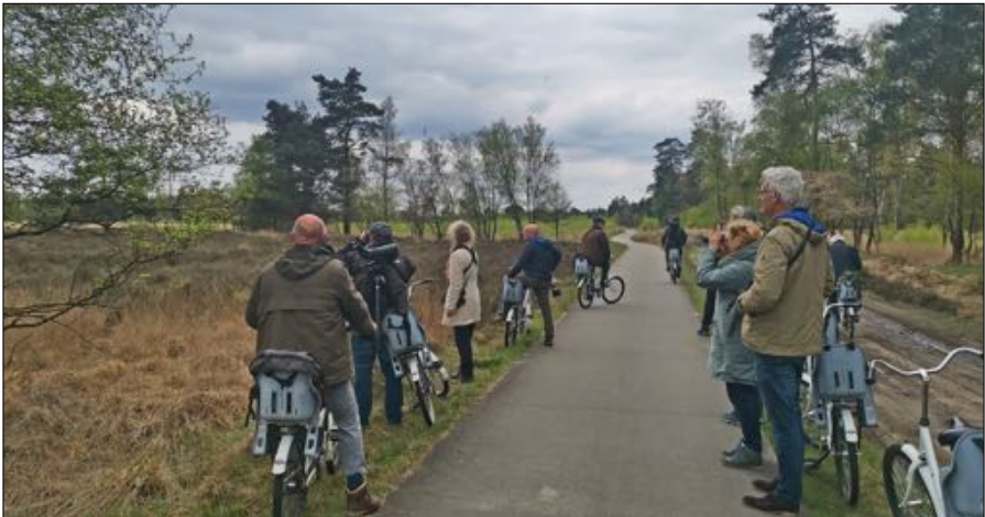
Per gratis fiets op verkenning in het Deelense Veld.

We parkeren de auto's in het park, ingang Hoenderloo. De bedoeling is om te gaan fietsen. Fietsen? Ja, gewoon lekker ouderwets fietsen, zonder versnelling, zonder hand-