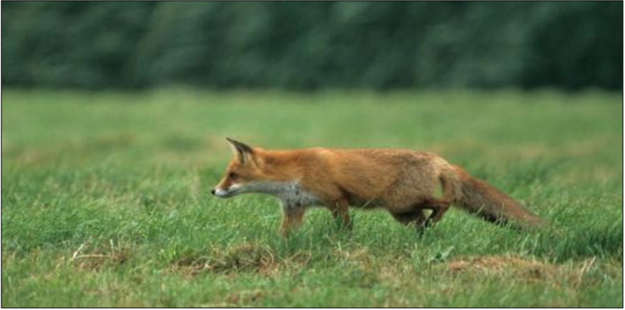
Vos op jacht in de weilanden rond De Putten.