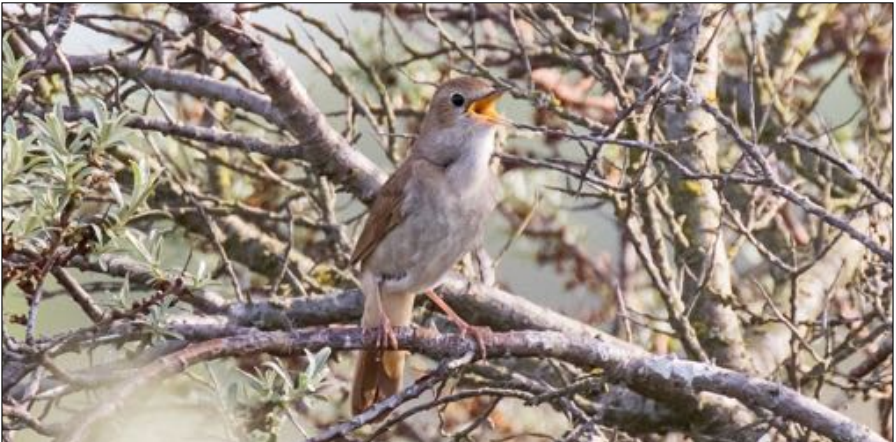
De Nachtegaal doet het goed in het duin door struweelvorming.

gaan of hebben zich verplaatst naar de meer open delen van het duin in het kustgebied of hebben hun toevlucht gezocht in de meer noordelijk gelegen kalkarme duinen ten noorden van Bergen, waar bosvorming trager verloopt en de konijnenpopulatie zich enigszins heeft hersteld.