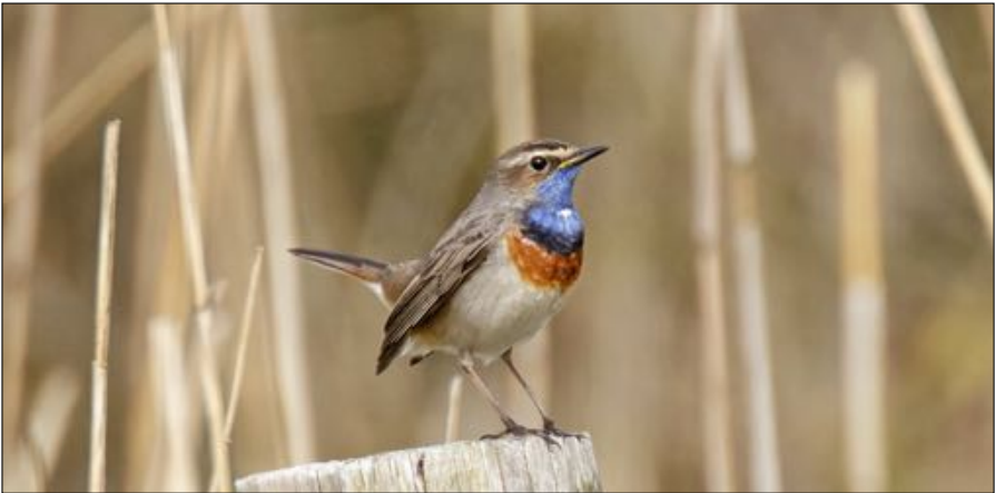
Ook de Blauwborst is door het Flevo-effect sterk toegenomen in Noord-Holland.

vogels laten zien. In 1970 broedden er enkele paren, weliswaar werd toen al gezinspeeld op enige toename, maar de groei heeft alle verwachtingen overtroffen. Ze broeden nu in opvallend aantal vooral in de lage delen van de provincie en het aantal broedparen wordt geschat op meer dan 6.500. Hoe de kolonisatie heeft plaatsgevonden is niet helemaal duidelijk, hoewel er al broedenclaves waren oostelijk van ons land en vermoedelijk ook hier het Flevo-effect een rol heeft gespeeld. Ook hier kan eutrofiëring en daardoor grotere vorming van algenvegetaties een rol hebben gespeeld, hoewel we dat niet zeker weten. Maar op de een of andere manier zijn delen van ons landschap kennelijk geschikter geworden om zich er te vestigen. Bij grote en opvallende soorten, zoals ganzen en eenden valt toe- of afname het eerst op. Maar er zijn ten gevolge van het Flevo-effect ook andere broedvogels verschenen. In 1970 was er nog