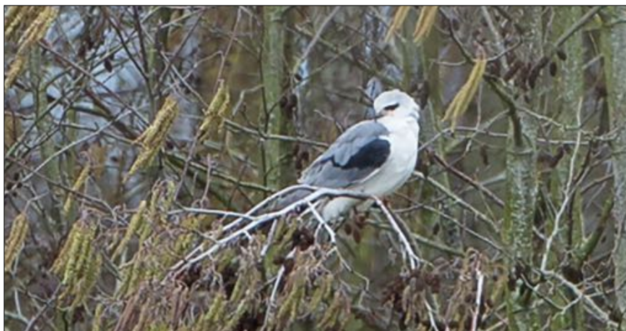
De Grijze Wouw bij Renesse.