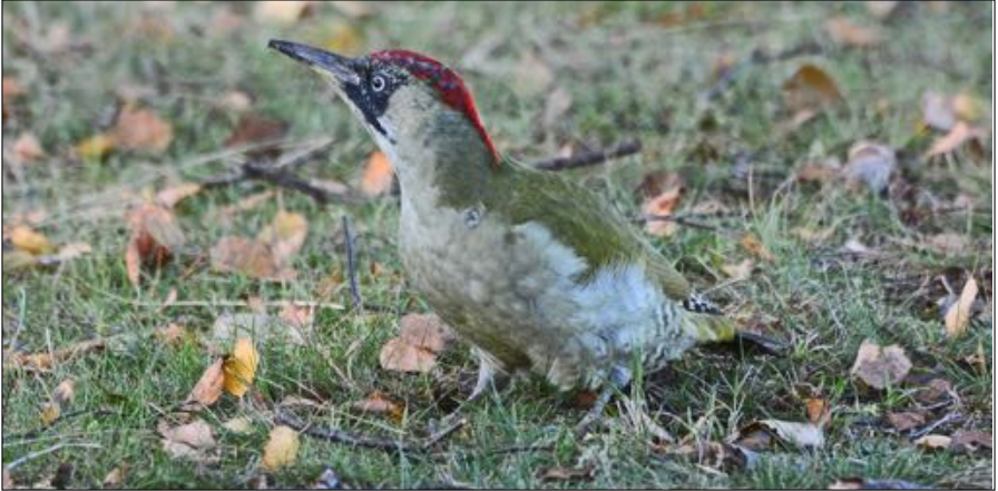
De Groene Specht heeft zich door predatiedruk van de Havik meer naar de binnenduinrand verplaatst.

Door veranderingen in de vegetatie, stadsuitbreiding en predatiedruk zijn er de afgelopen halve eeuw grote veranderingen opgetreden in de verspreiding van heel veel vogelsoorten. In een aantal gevallen heeft dat tot afname van bepaalde soorten geleid of zelfs het verdwijnen ervan, in andere gevallen juist tot toename. Verder valt op dat er ook