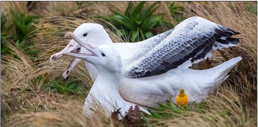
Southern Royal Albatross.

Veel van deze barre eilanden zijn ook aangewezen als UNESCO-werelderfgoed en worden goed beschermd, zodat ze moeilijk te bezoeken zijn. Deze lezing zal dus gaan