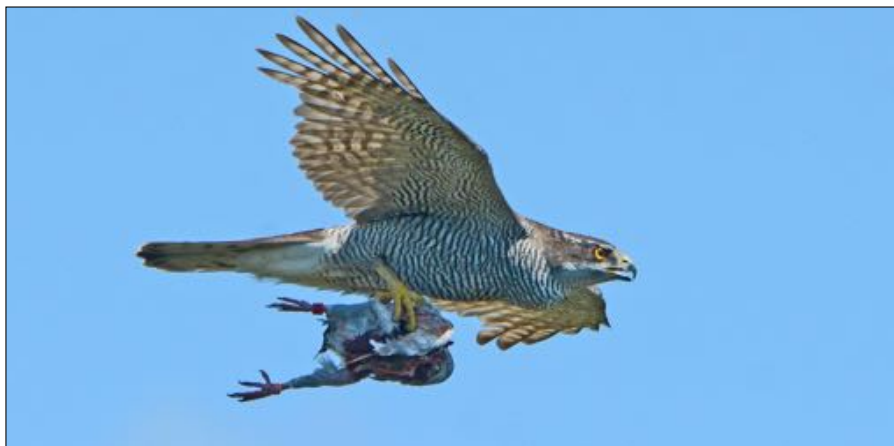
Havik met geslagen Postduif op weg naar de jongen.