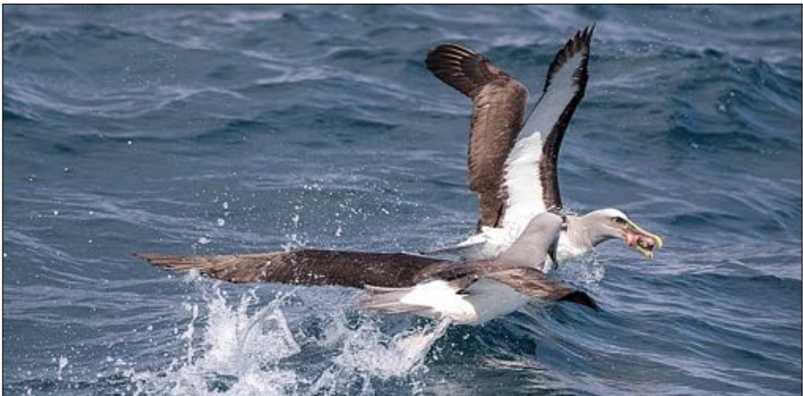
Nothern Buller's Albatross.

September 13: Birding Down Under door Marc Guyt