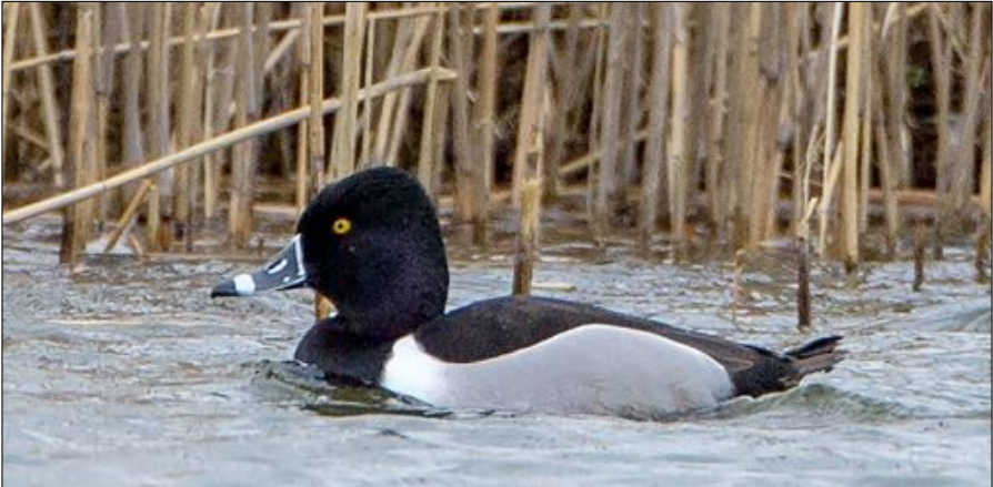
Man Ringsnaveleend, Park van Luna, Heerhugowaard, 17 maart 2023.

15 Wilde Zwanen over het Pompstation Bergen en op 4 april werden er vier vanaf de Abtskolk gemeld. Op 13 en 15 april werd langs de kust telkens één overtrekkende Witbuikrotgans gezien. Veruit de bijzonderste waarneming uit deze periode was die van een mannetje Siberische Taling die op 18 maart in het Park van Luna in Heerhugowaard werd ontdekt. De vogel zat in een groep Smienten maar verdween met deze vogels al binnen twee uur na de ontdekking. Desondanks wisten zo'n 25 mensen deze nieuwe soort voor ons werkgebied te zien. Op 10 april zat er een mannetje Krooneend nabij Koedijk. Nóg een nieuwe soort voor de regio was de Ringsnaveleend die op 12 maart werd ontdekt in het Park van Luna in