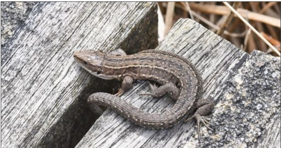
Levendbarende Hagedis bij de Deelense Wasch.

In colonne rijden we langzaam achter elkaar aan, soms met raam open om eventueel zingende vrienden te ontwaren. Maar uit de auto zie en hoor je het meest en dus wordt onze in- en uitstap techniek flink geperfectioneerd. Aan de Reemsterweg stoppen we om de Edelherten te bewonderen. Best een flinke groep van ongeveer 20 hinds.