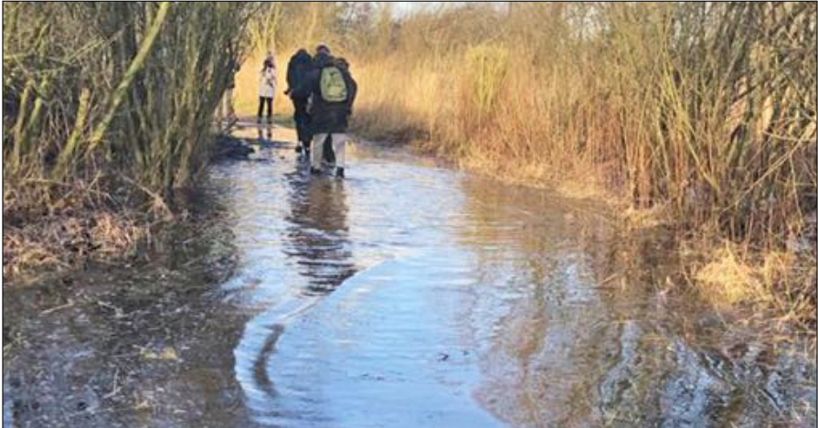
Op de terugweg van de hut werden we verrast door "hoogwater".

Volgens plan vertrokken we om 07.00 uur met twee auto's en zeven vwg-Alkmaarleden. De chauffeurs Rob en Elias zouden weer aardig wat kilometers rijden vandaag. Na een paar druppels op de voorruit bleef het de rest van de dag droog en