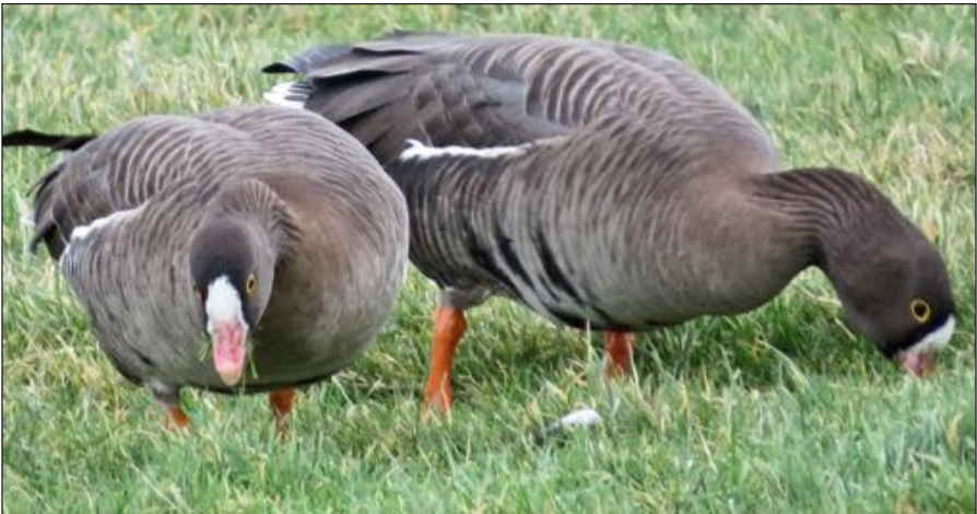
Dwergganzen, VHP-Nessedijk, 20 januari 2021.

3. Dwergganzen , meestal ver weg en in greppels, laten Nederland steeds vaker links liggen. Van lang niet alle gezenderde en gekleurringde vogels is ook het overwinte-