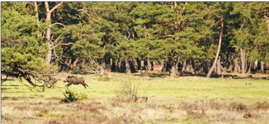
Op de valreep een prachtige waarneming van een jagende Wolf op Wilde Zwijnen!