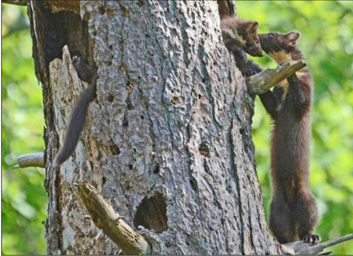
Boommarter met jongen in de Schoorlse Duinen, nieuwe predator in het duin.

het duin verdwenen door de uitbraak van de virusziekten myxomatose en RHD (VHS). Rond de jaren zeventig waren daarvan de eerste gevolgen zichtbaar. Herstel heeft hier en daar plaatsgevonden, maar nog altijd is de konijnenstand laag en waar konijnen nog aanwezig zijn, zijn ze niet in staat de oude vegetatie te herstellen. In plaats daarvan heeft men op veel plaatsen schapen, Heckrunderen, paarden, zelfs Wisenten ingezet om het duin open te houden, vaak met nadelige consequenties voor de vegetatie.