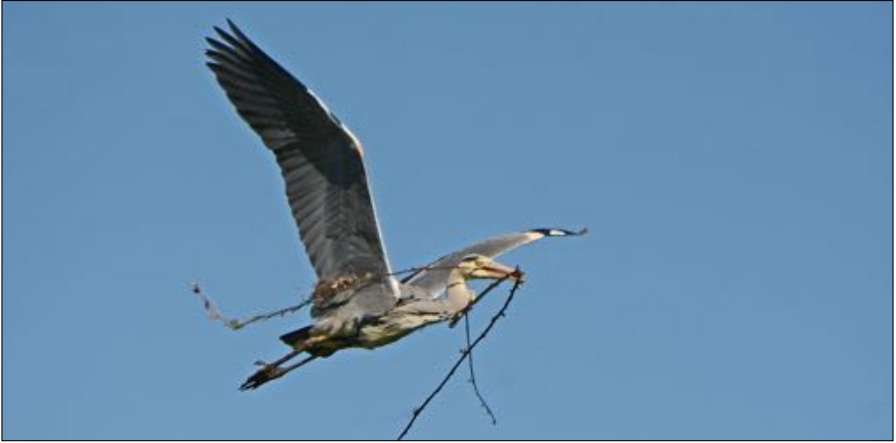
Blauwe Reigers profiteren van de zachte winters.