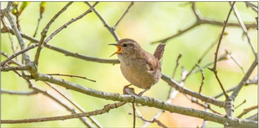
Door minder strenge winters is de Winterkoning tegenwoordig talrijker.

We beschikken nauwelijks over gegevens van aantallen broedvogels in de 19 e en begin 20 e eeuw, maar standvogels als Huis- en Ringmus, Winterkoning, Merel, Boomkruiper, mezen en Goudhaan moeten in die tijd, waarin strenge winters regel waren, zeker minder talrijk geweest zijn dan nu. Niet alleen zijn de winters nu minder streng, maar veel soorten nemen 's winters nu ook hun toevlucht tot stedelijke gebieden, waar het warmer is en meer voedsel aanwezig is. Maar schommelingen in de jaarlijkse aantallen van dergelijke soorten kunnen vaak nog worden herleid tot min of meer ongunstige winteromstandigheden. Ze zijn echter niet altijd goed te documenteren, omdat het gaat om algemeen voorkomende soorten die niet goed te tellen zijn. Van de Zanglijster weten we dat na 1971 door enkele opeenvolgende strengere winters de