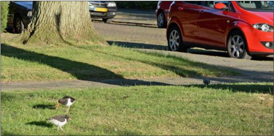
Scholekster met jong in het stedelijk gebied van Alkmaar.