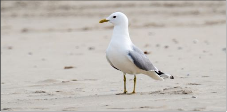
De grootste Europese kolonie Stormmeeuwen is door toedoen van de Vos uit de Schoorlse duinen verdwenen.