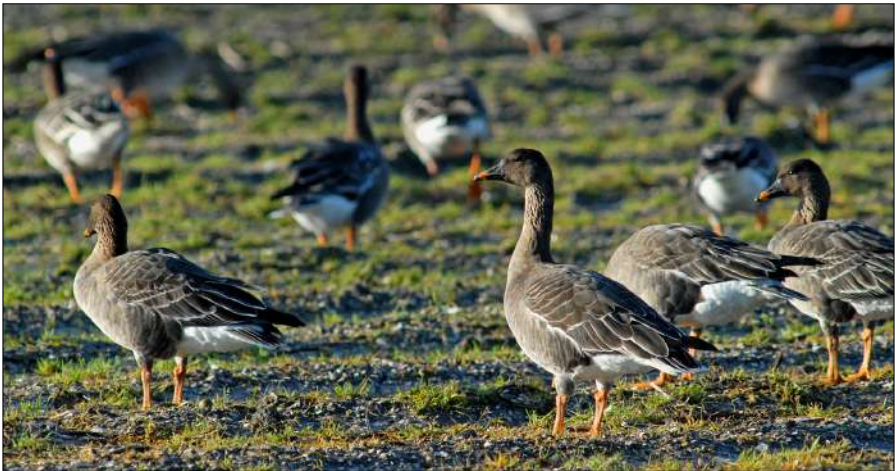
Toendrarietganzen in de Wieringermeer.

In de haven van Den Oever doken een paar Dodaarsjes op en op de kant zaten ca. 25 Wintertalingen , een paar Slobeenden , Krakeenden , Meerkoeten , Kuifeenden , Aalscholvers en zelfs twee Tureluurs . Ook zagen we een Oeverpieper vliegen. Op de pier tussen de sluizen en de Zuiderhaven zagen we 6 Vinken , een Grote mantelmeeuw , Futen , Meerkoeten , Wilde Eenden , Kuifeenden , 6 Dodaarsjes , de alom tegenwoordige Aalscholvers , een groep Kieviten , nog een Tureluur , en iemand zag nog een Steenloper . Op het grote water zaten even twee mannetjes Grote Zaagbek . Ze waren moeilijk zichtbaar op het door de harde wind onrustige lichtgrijze water en het door de even schijnende zon op de golven weerkaatsende zonlicht, dat recht in onze kijkers striemde. Bij de Zuiderhaven/werkhaven konden we het beter zien. In de luwte van het riet dreven Nonnetjes , een paar prachtige mannetjes en meerdere vrouwtjes. In de scoop echt een