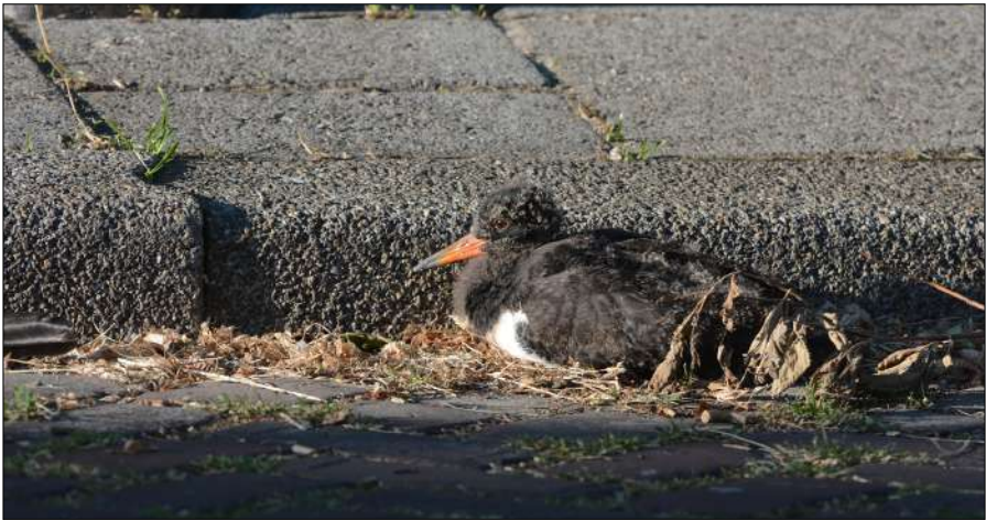
Overleven in een veranderende wereld. Zonnen in de avondzon, jonge Scholekster naast de stoeprand in Alkmaar.

Ooit, het was 1947, verzuchtte de dichter J.C. Bloem in het gedicht De Dapperstraat "Wat is natuur nog in dit land, een stukje bos ter grootte van een krant". In 2020 is er van de 'krant' nog een 'snipper' over. Het advies van Bloem was: verzoen je maar met