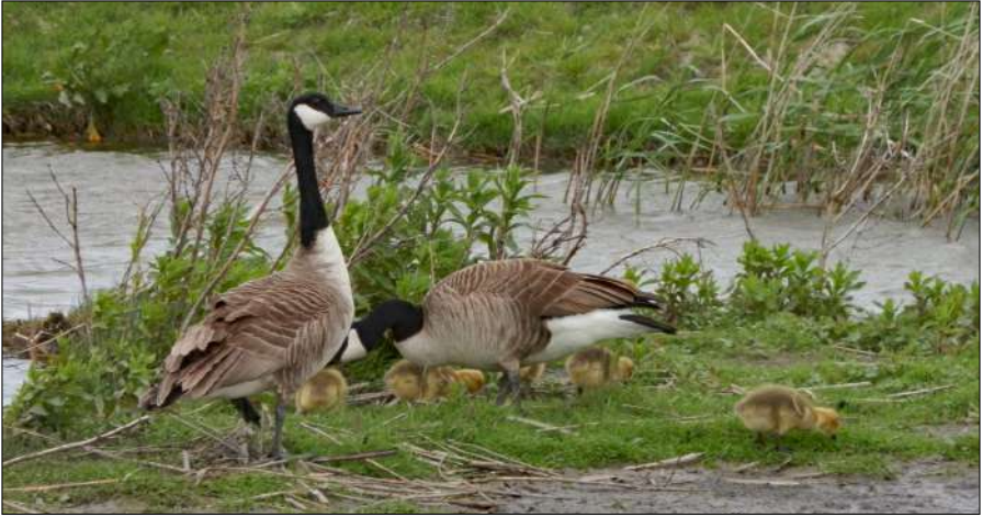
Familie Grote Canadese Ganzen, Geestmerambacht, 12 mei 2015.

droegen, getolereerd. Zij misten zijn halsband als extra uiterlijk kenmerk (Limosa 2020, nr.2). Bij veel vogels duurt het leggen van een ei 20 tot 60 minuten. Maar de Koekoek heeft haast en doet dat gemiddeld in 13 seconden (het Vogeljaar 2020, nr.2.).