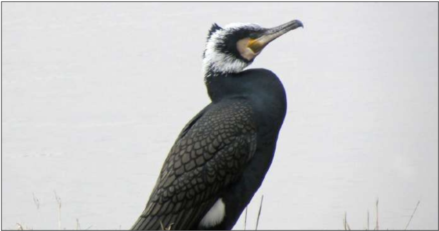
Aalscholver, Alkmaar RAK-Noord, 3 maart 2018.

Een ieder kent het beeld van de op lichtmasten posterende Aalscholvers . Zij drogen de vleugels in de wind en maken toilet. Ook verteren zij de vismaaltijd: in twee uur tijd zeven enorme flotsen stinkende vogelpoep (NRC Handelsblad, 21 juli 2020). Twee Grauwe Kiekendief -mannen vertrokken op 16 augustus 2006 uit Finsterwolde,