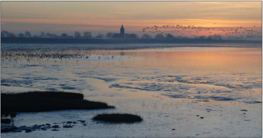
Het Schor bij Den Oever.

Op zoek naar meer ganzen zochten we rondom Westerland en de Haukes, maar daar was geen gans te bekennen en ook niets anders. Dus verder naar het Normerven. Onderweg zagen we Zwarte Kraai , Ekster , paartjes Nijlganzen , Kuifeenden , Waterhoen , Wilde Eenden , Fuut , Houtduif , Huismussen en een troep Spreeuwen . Bij het Normerven zaten in het weiland grote groepen Grauwe Ganzen en Brandganzen , een paar Canadese Ganzen , een Kolgans en een Fazant -haan. In een watertje daarachter een groep Scholeksters . Op het Normervenwad zaten Slobeenden , Krakeenden , Wulpen en Kieviten