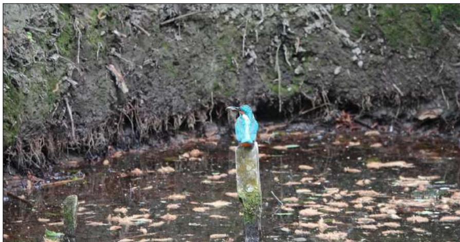
Ook in de Rekerhout is met succes gebreed.