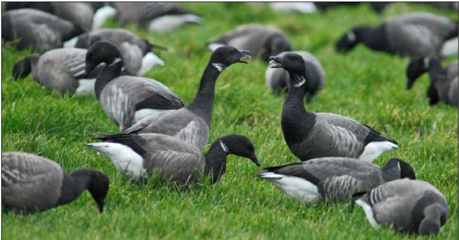
Rotganzen op Wieringen

Met elf mensen in drie auto's vertrokken we ruim na 8 uur noordwaarts, begeleid door fantastische zonsopgangskleuren. Onderweg zagen we groepen Kauwtjes , 2 Grote Zilverreigers , vele Aalscholvers , wat Futen , Meerkoeten , Grauwe Ganzen , een Blauwe Reiger en een weiland vol Knobbelzwanen. Door een misverstand belandden een auto aan het begin en twee auto's aan het eind van het Balgzandkanaal. Uiteindelijk dankzij de mobieltjes toch bijeen aan het eind bij het Amstelmeer, keken we uit over het Balgzand door een stenen kijkwand met kijkgaten op precies de verkeerde hoogten, namelijk te hoog of te laag. Dat werd geheel goed gemaakt door een mannetje