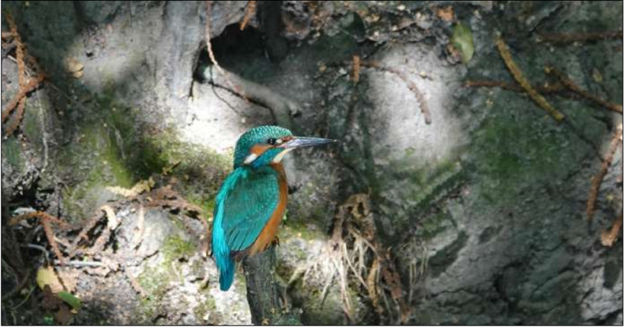
Het paartje in Hortus Alkmaar bracht twee broedsels groot.

In de Oudorperhout, in de Schermer achter de Leedjes, naast de golfbaan in de Bergermeer, de Rekerhout, in de Groene voet en bij Hortus Alkmaar waren in ieder geval territoria. Mogelijk zijn alleen de Hortus en de Rekerhout succesvol geweest.