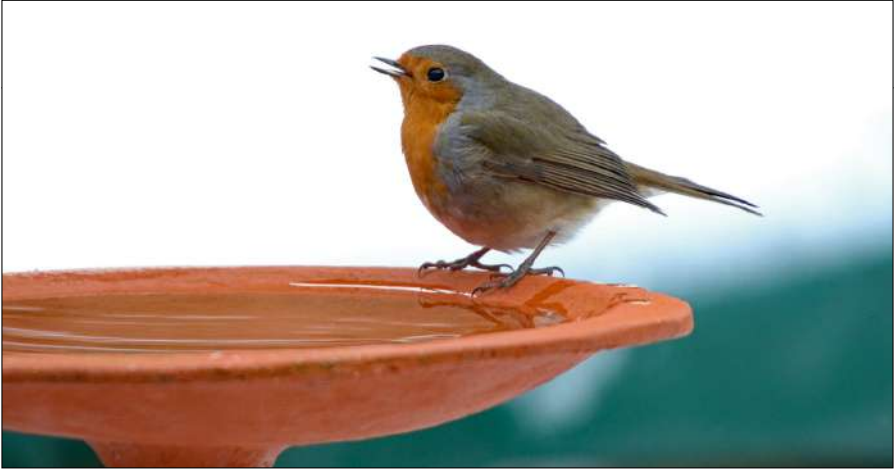
Drinkschaal op stok, veilig tegen katten.

ze afdoende pret. En wat ook zo heerlijk is, is dat ze heel aanhankelijk zijn. Als ik thuis zit te werken, zitten ze op schoot of op mijn bureau. Tot ietwat teleurstelling van mijn vrouw. Ze komen namelijk alléén bij mij zitten. Voor de TV liggen ze uitgestrekt op mijn benen te spinnen. Dat geronk is een rustgevend geluid. Daar kan geen cursus mindfulness tegenop. Een kat, ik kan het u van harte aanbevelen. En er is maar één ding leuker dan een kat, en dat zijn er twee.