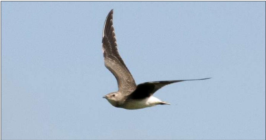
Steppevorkstaartplevier, Grootdammerpolder, 5 september 2020.

Na een korte pauze werd de Steppevorkstaartplevier van De Putten e.o. op 5 september een paar kilometer zuidelijker in de Groeterpolder teruggevonden. De vogel liet zich daar geweldig zien en trok veel publiek. Ook de vogel beviel het blijkbaar prima want op 13 oktober bleek ie een vriendje gebeld te hebben voor gezelschap. Heel