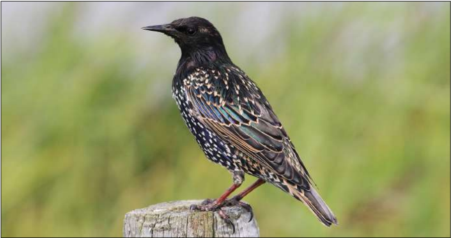
Ook de Spreeuw in de beklaagdenbank.

eisen. Het ‘nee, tenzij’-beleid zoals vermeld in het coalitieakkoord zal worden vertaald met de uitkomst van de Regionale Energiestrategie Noord-Holland Noord (RES NHN). Aangezien de RES NHN in gezamenlijkheid met de provincie, de gemeenten de waterschappen en andere stakeholders wordt opgesteld en er lokale participatie zal plaatsvinden geeft de RES NHN aan of de dan voorgestelde windenergie kan rekenen op draagvlak. Aangezien het proces van de RES NHN nog niet voltooid is wordt daarop met de onderhavige wijziging van de verordening buiten de MRA nog niet vooruit gelopen. Gelet op het voorgaande is ervoor gekozen om vooralsnog een verbod voor nieuwe turbines in Noord-Holland op te nemen. Initiatieven die reeds vergund zijn kunnen worden gerealiseerd en bestaande turbines mogen onder voorwaarden worden vervangen.”