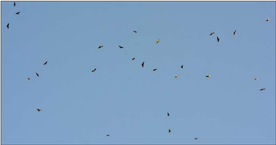
Klein deel van de paar honderd langstreckende Buizerds over De Omloop in Schoorl, 16 oktober rond 17:00 uur.

De vogels blijven koers houden naar het zuidwesten en komen in België en Noord-Frankrijk uit bij de zee. En dan ontstaat er verwarring: deze Buizerds zijn gewend over