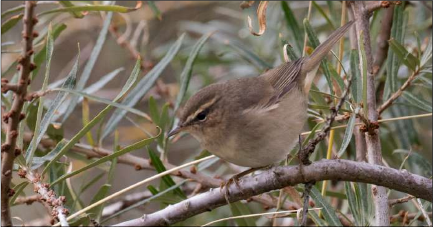
Bruine Boszanger, Hondsbossche Zeewering, 18 oktober 2020.