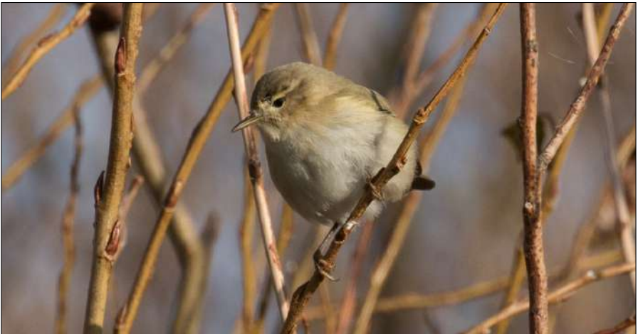
Siberische Tjiftjaf, Texel Robbenjager, 7 november 2020.

bijvoorbeeld enkele waarnemers er twee en zelfs drie op een ochtendje ontdekten... De eerste zat tussen 17 en 19 oktober op de HBZ. De tweede zat op 22 oktober in de Grootdammerpolder en daarna werden er tussen 9 en 19 november een handvol in het NHD gezien. Ook Siberische Tjiftjaffen deden het goed met 5 à 6 stuks in het NHD. Een Buidelmees vloog op 8 november over Camperduin.