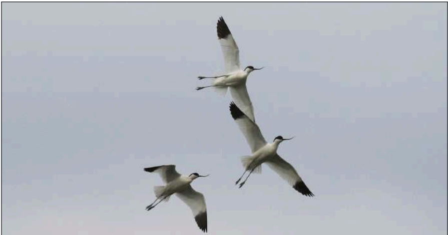
Dit jaar hadden de Kluten bij de Leihoek veel last van nestpredatie.

Het nieuw aangelegde plasdras-gebied De Leie (in de Leihoek) heeft zijn waarde al aangetoond: 25 Kluten, 2 Tureluur-paartjes, 2 Bontbekplevieren en de Engels Gele Kwikstaart kozen in het eerste jaar hier hun broedplek!