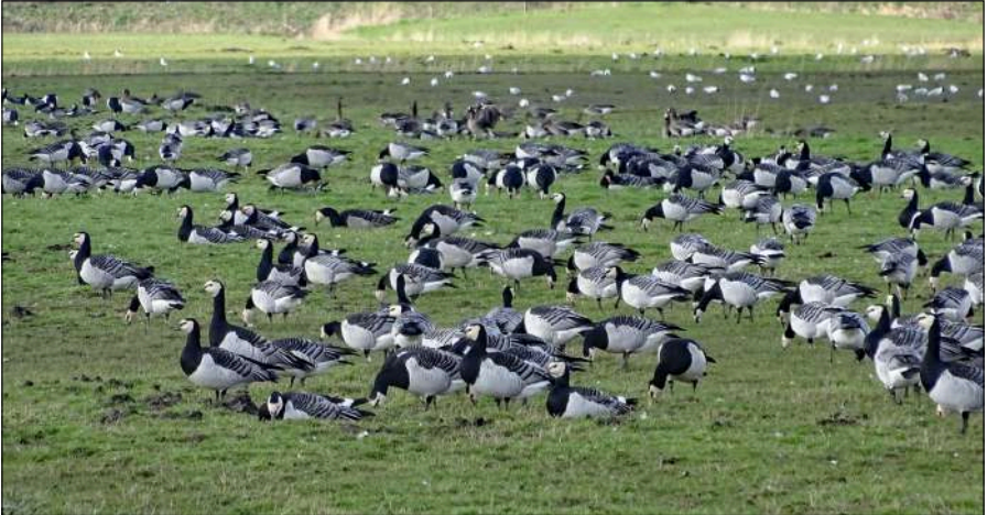
Brandganzen, Eempolder, 14 maart 2020.

Wij zijn richting de Oostvaardersplassen gereden om te proberen die Zeearend nog te zien. Uiteindelijk is dat gelukt: ik heb vanuit de door de wind wiebelende auto, met de telescoop rustend op Tom zijn schouder twee stipjes gezien die arenden waren die ergens aan zaten te eten.