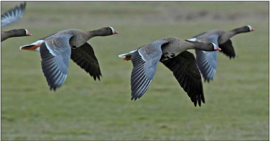
Het gebied is nog steeds belangrijk voor overwinterende Dvergganzen.