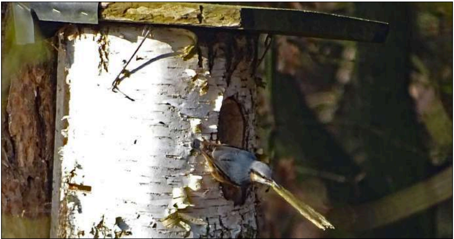
Opruimen van het huis als populaire bezigheid in coronatijd.