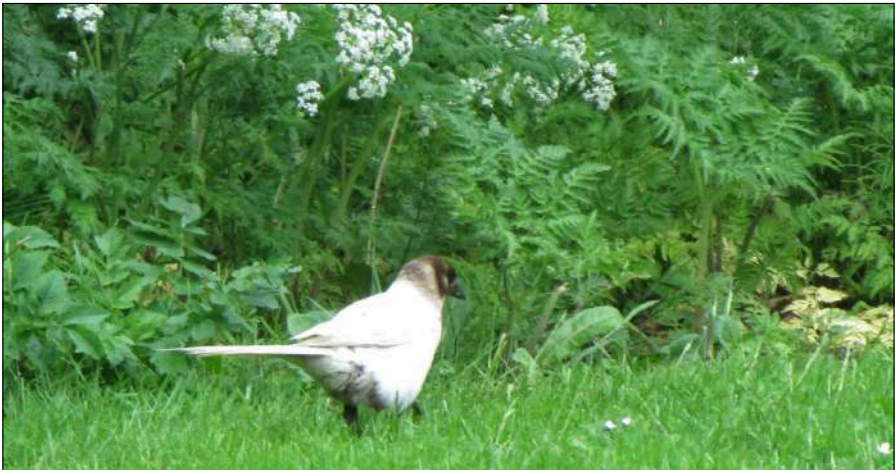
Rekerhout, 22 mei 2016.