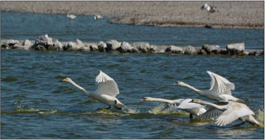
Wilde Zwaan kort ter plaatse in De Putten, 24 april 2020.