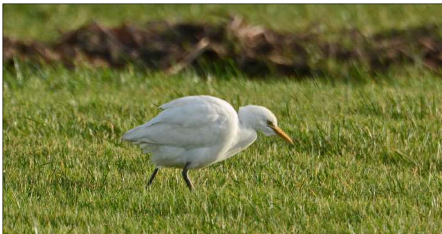
Koereiger, zeldzame gast in de polders achter de Hondsbossche Zeewering, 1 januari 2018.