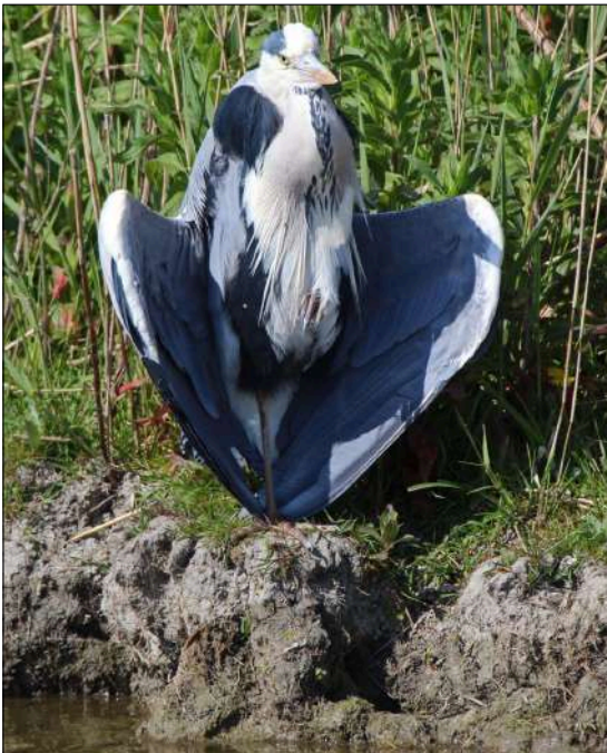
Wat is het warm en het is nog maar april, zonnende Blauwe Reiger , Kleimeer, 26 april 2020.

was! Het overgrote deel verbleef in tuinen en alle exemplaren waarbij de ondersoort bepaald kon worden, waren meend's . Er werden maar liefst 57 waarnemingen van Velduilen ingevoerd. De gehele periode verbleven er tot twee op de HBZ en ruime omgeving en ook in de Zuurvenspolder was er een tijdje een aanwezig. Ook in de Kleimeer werd er af en toe een gemeld maar verwarring met een aldaar regelmatig overdag jagende Ransuil is niet uitgesloten... En bij het wachten op de Havikarend werd er ook nog één bij Egmond gezien. Op 25 april werd bij Koedijk een Draaihals waargenomen. De volgende liet niet lang op zich wachten en verbleef op 29 april bij het Hargergat. Tussen 28 februari en 2 maart verbleef een afwijkende pieper nabij de Abtskolk.