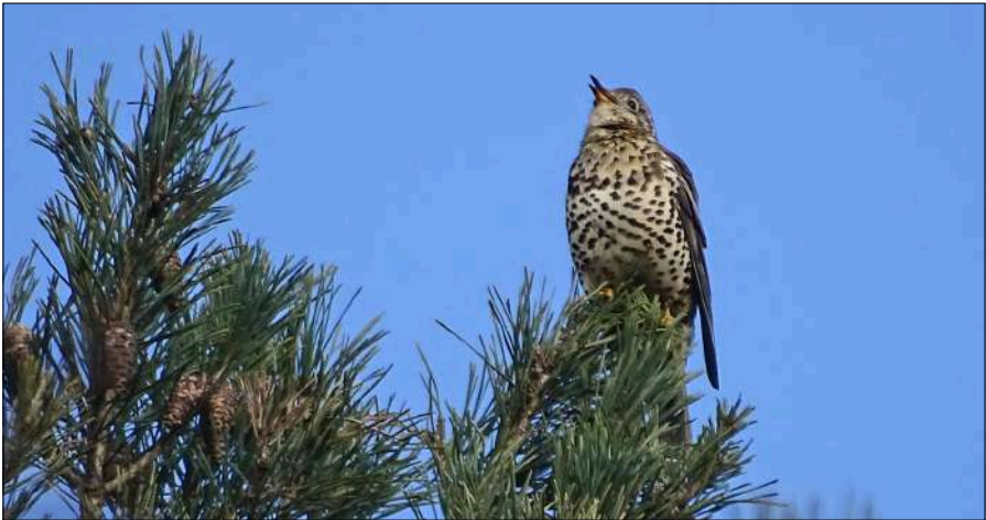
Grote Lijster, Blaricummerheide, 14 maart 2020.

Toen we vlakbij de vogelkijkhut waren, bleek deze nog steeds onbereikbaar door het hoge water. We klapte mijn statief uit maar dit was niet stevig genoeg om mijn telescoop stil te houden in dit stormachtige weer. Nu was het niet zo'n hele grote ramp, want de Zearend was niet (zoals twee weken daarvoor wel het geval was) te zien. Helaas vlogen er vandaag ook geen duizenden meeuwen op om ons te duiden waar de