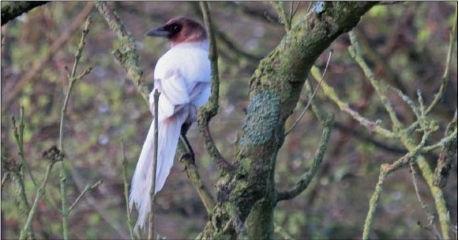
Rekerhout, 17 maart 2020.

Een correcte typering van de verschillende kleurafwijkingen is lastig en de literatuur staat vol met verwarrende fouten. Het bepalen van de kleurafwijking 'in het veld' is niet altijd mogelijk. Maar nu weten we het: de 'witte' Eksters van de Rekerhout betreffen opeenvolgende generaties met een erfelijke afwijking die een verbleking van het pigment veroorzaakt, welke nog worden versterkt door het (zon)licht. Zij vormen het levende bewijs dat vogels met een sterke kleurafwijking ook in het wild met succes kunnen broeden. Belangstellenden kunnen het (Engelstalige) artikel van Hein van Grouw met de indeling, met uitgebreide toelichting, van de kleurafwijkingen bij vogels bij mij opvragen ( of downloaden van internet, red. ).