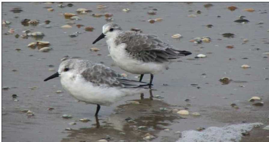
Drieteenstrandlopers, Hondsbosschestrand, 26 oktober 2016.