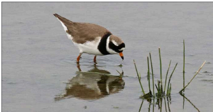
De Bontbekplevier, broedvogel en doortrekker.