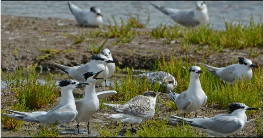
Grote Sterns met jongen in De Putten.

Ik probeer door de waarnemingen van de laatste jaren in dit gebied te inventariseren een overzicht te krijgen van de veranderingen die zich hier voordoen. Onder meer door de vogelaantallen en -soorten in beeld te krijgen en misschien iets over de natuur en vooral de vogelontwikkelingen in dit gebied te duiden. Uiteraard de voor dit gebied kenmerkende en belangrijke vogelsoorten van plas-drasgebieden, zoals de ganzen, plevieren, meeuwen en sterns. Niet de zeevogels op zee en ook niet alle kleine zangers die