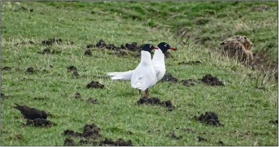
Zwartkopmeeuwen, Huizen De Kampen, 14 maart 2020.