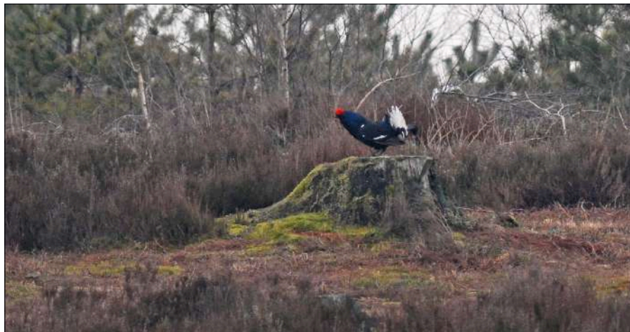
Baltsend Korhoen, Sallandse Heuvelrug, 14 april 2008. Dat jaar werden nog 12 hanen geteld.