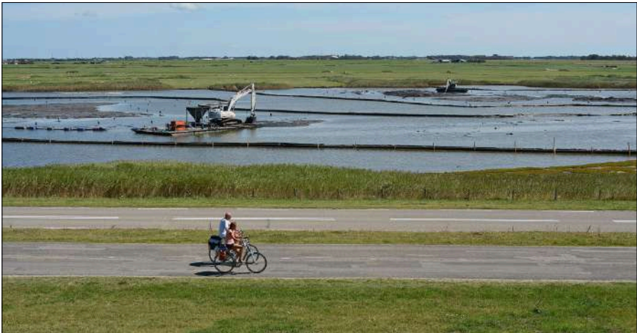
Aanleg van broedeilanden in De Putten, 8 augustus 2015.

De belangrijkste zijn het realiseren van schelpeneilandjes en uitbaggeren van De Putten. Door ecologisch adviesbureau Ten Haaf en Bakker begeleid heeft dit tot een spectaculaire uitbreiding van de Grote Stern geleid: in 2018 met een altijd tot discussie leidend aantal van ruim 3000 broedparen met een broedsucces van gemiddeld 0,7