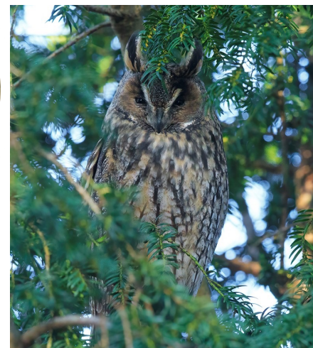
Ransuil - Lidi de Boer