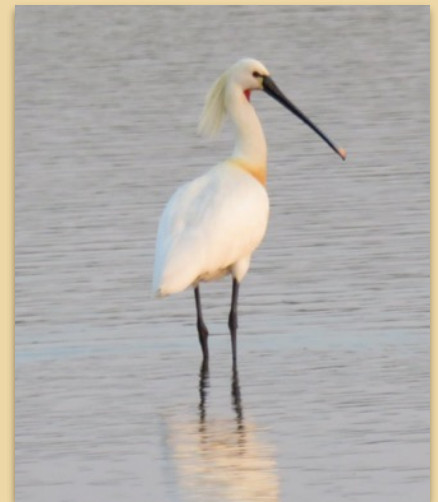
Lepelaar - Ruud Costers

In Nederland en Europa neemt het aantal broedpaar toe. Betekent dat dat we lui achterover kunnen hangen? Aan de hand van kleuring gegevens en zender-data volgen we het wel en wee van de Lepelaars. De Lepelaars die in Nederland broeden overwinteren op verschillende plekken. Doen mannetjes en vrouwtjes hetzelfde? Allemaal vragen waarop we antwoorden proberen te vinden door de Lepelaars kleuringen om te geven en te zenderen. Iedere Lepelaar krijgt zijn eigen kleuringcombinatie. Zo worden het individuen en daarmee kunnen we ze volgen door de jaren heen van broedgebied naar overwintersgebied en weer terug.