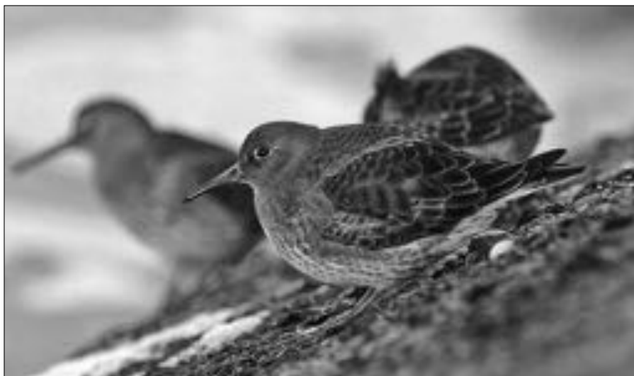
Paarse strandlopers langs de HBPZ.