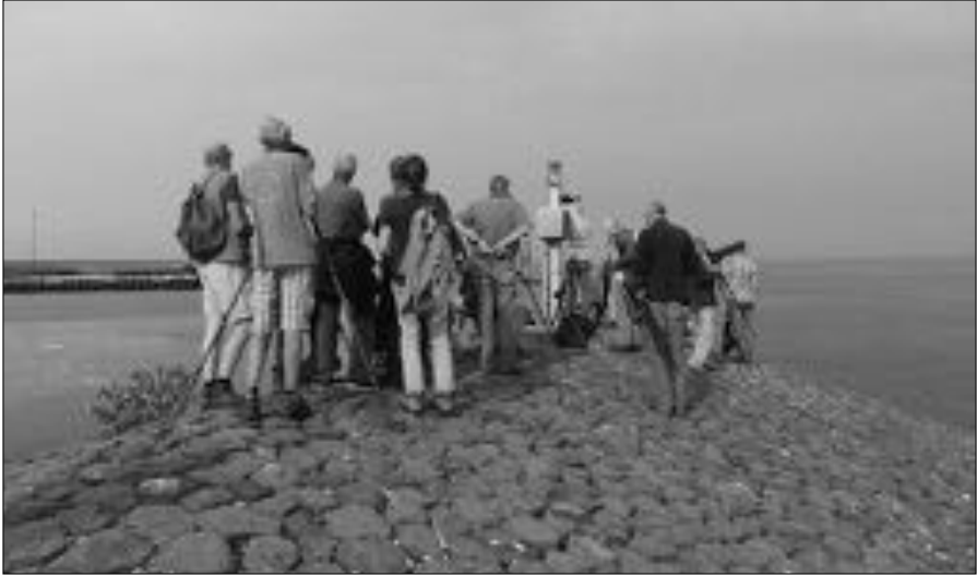
Op zoek naar de Koningseider bij de NIOZ-haven.

snel op wat Watersnippen voor wij instapten. De grijze lucht vanuit het westen had inmiddels een groot deel van het eiland in beslag genomen. Zeedamp!! Snel naar de Mokbaai. Lepelaar en Kleine zilverreiger waren lichtpuntjes en natuurlijk de score van Indische gans , Wulp , Rosse grutto , Kanoet , Pijlstaart , Smient , Zilver- en Goudplevier . De