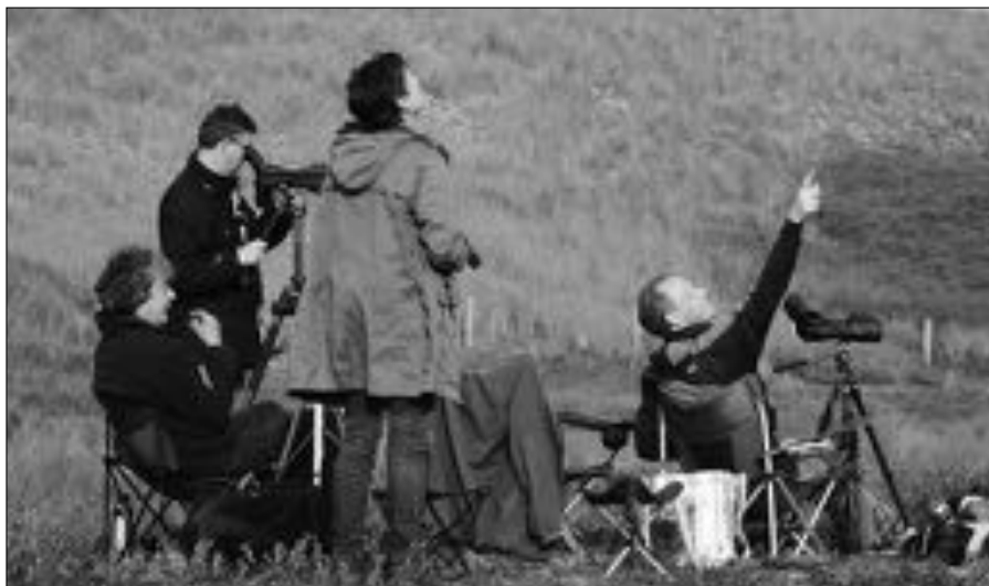
Telpost Bergen aan Zee, altijd spannend.