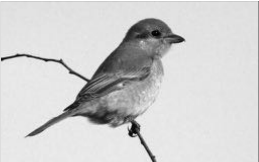
Daurische klauwier, 18-oktober 2014, Wimmenummerduinen.

Op 31-8 werd een Buidelmees gezien in de Abtkolk en op 15-10 zat er 1 bij Koedijk. Eén van de hoogtepunten uit deze periode was de erg fraaie Daurische klauwier die