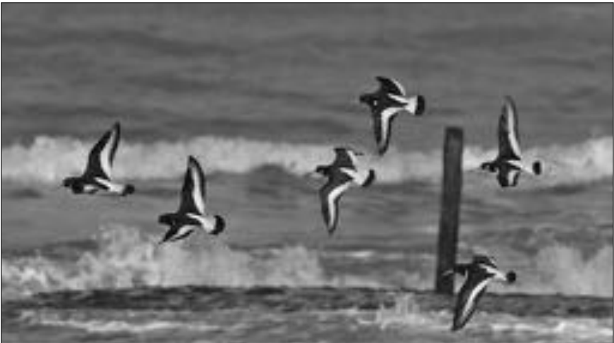
Groepje Scholeksters langs de Hondsbossche Zeewering.