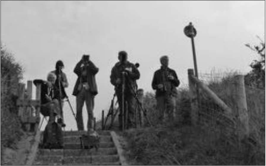
Op de uitkijk bij de Slufter.