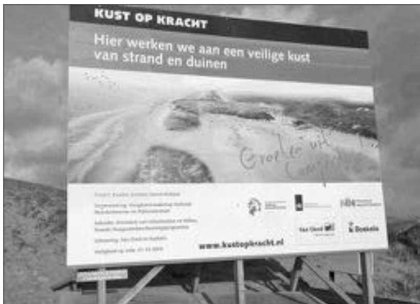
Aankondiging zandsuppletie, 29 december 2013.

In 2014 wordt door sleephopperzuigers 35 miljoen kuub zand voor de Hondsbossche en Pettemer Zeewering (HBPZ) aangevoerd. Dan ligt er 70 miljard kilo extra zand met een oppervlakte van 400 hectare voor dit eens zo machtige dijklichaam. In de loop van 2015 krijgt een nieuw duinlandschap gestalte. De voorstanders van de zandsuppletie zijn politici, projectontwikkelaars, baggeraars en ondernemers. Inwoners betwijfelen of deze ingrijpende operatie wel noodzakelijk is voor de kustveiligheid. Natuurbeschermers maken zich zorgen over de gevolgen voor flora en fauna. De motivaties bij de negatieve besluiten van de rechterlijke macht over de aangespannen procedures komen weinig geloofwaardig over. Met het onder het zand verdwijnen van de 38 strekdammen verliezen meerdere vogelsoorten een belangrijk foerageergebied. In vrijwel alle afleveringen van