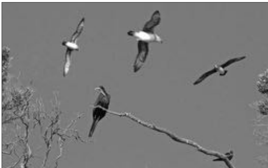
Kermadec stormvogels met Grote fregatvogel.