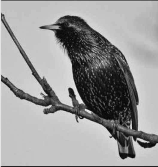
Spreeuw, ook in Alkmaar veel minder aanwezig

Afgelopen week (tweede helft oktober) hebben we de eerste echte najaarsstorm gehad. De westenwind beukte met windkracht 8/9 op de kust en bracht daarmee meerdere zeevogels dicht bij de kust. Ik heb begrepen dat donderdag de 23e oktober meerdere leuke soorten voor de kust bracht zoals verschillende (pijl)stormvogels, verschillende jagers, Kleine alken, etc. Zaterdag 25 oktober kon ik zelf weer een paar uur over zee kijken bij zeetrektpost Camperduin. Deze keer geen storm, maar een westenwind