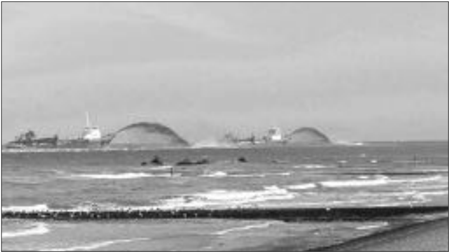
Sleehopperzuigers in actie, 16 april 2014.