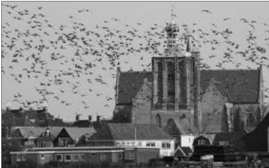
Brandganzen bij Workum.

Het gebied tussen Zurich, Oudega en Makkum is in de winter de thuisbasis voor enorme aantallen ganzen en andere watervogels. Daarnaast zijn er nog enkele buitendijkse waarden waar zich ook vaak grote aantallen vogels verzamelen. In een zachte winter veel Kieviten, Goudplevieren en Wolven en in strenge winters duiken er weer