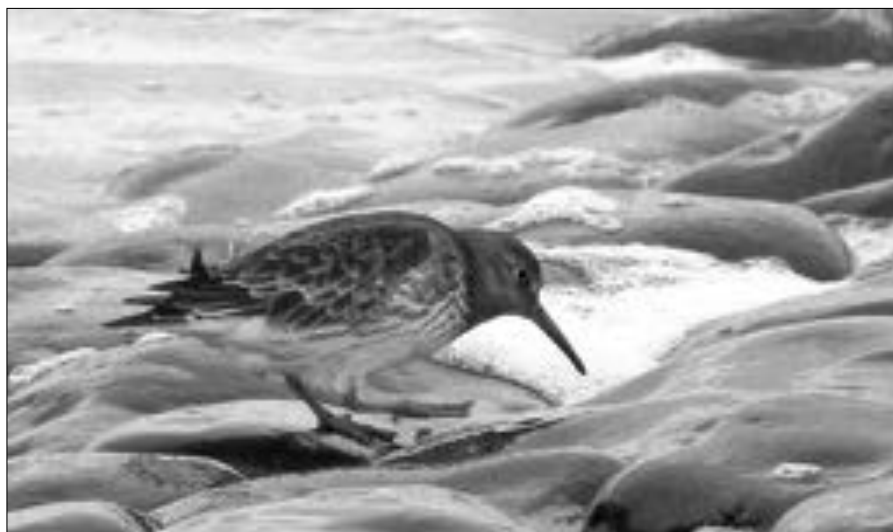
Foeragerende Paarse strandloper, HBPZ, 19 december 2013.

Tijdens de jaarlijkse Sovon-midwintertellingen medio januari zijn in 1978 411 Paarse strandlopers geteld en vanaf 2004 schommelen de aantallen tussen 166 en 384 stuks.