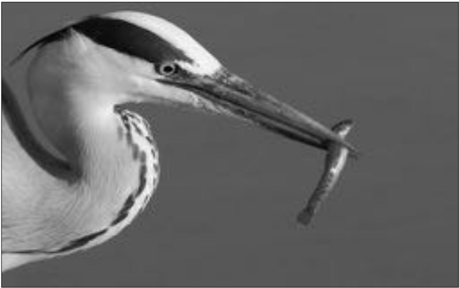
Blauwe reiger met Kleine modderkruiper.

Verspreid over de periode werd regelmatig een Roerdomp gezien in en nabij de Abtskolk. Kleine zilverreigers blijken weer snel uit het dalletje te klimmen na weer eens een zachte winter. Er werden op meerdere plekken leuke groepen gezien: op 10-8