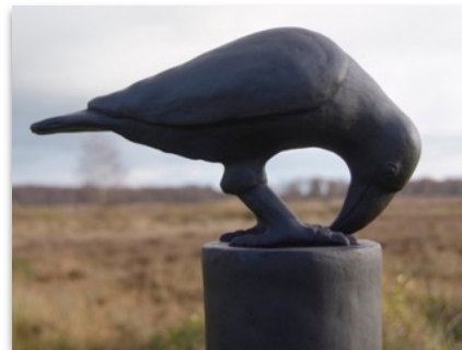
Lia van Rijn - keramiek