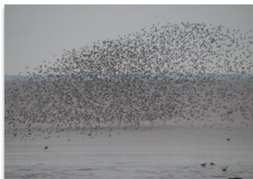
Foto: Kanoeten boven het wad.

Aanmelden: U kunt zich opgeven via de website www.gaatumee.nl , ter plekke aanmelden en betalen kan ook.