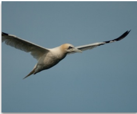
Jan van Gent - Hans Brinks

Wie met een verrekijker op zoek gaat naar vogels, ontdekt hoe spannend en sprankelend de Nederlandse natuur kan zijn. Tijdens de Nationale Vogelweek krijgt iedereen de kans kennis te maken met die verrassende vogelwereld om de hoek. Dan sta je opeens zomaar oog in oog met een specht, een ijsvogel, een grutto, een havik of ontdek je hoe fraai alledaagse soorten als een groenling of putter van dichtbij zijn. Onder leiding van enthousiaste en deskundige vogelkenners ontdek je hoe ongelooflijk rijk ons land is aan vogels en hoe leuk het is om vogels te kijken. Deelnemers krijgen tips over vogelherkenning en krijgen veel vogels van heel dichtbij te zien door de telescoop van de excursieleider. Iedereen kan meedoen en de meeste activiteiten op www.vogelweek.nl zijn gratis.