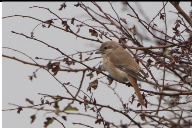
De Daurische klauwier