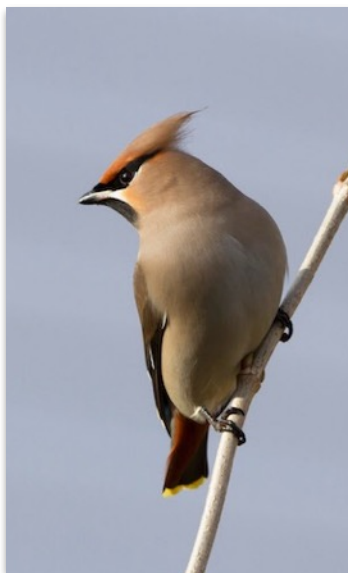
Pestvogel